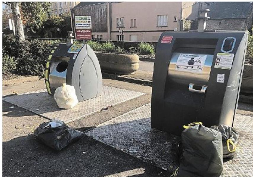
Pour la gestion des ordures ménagères, Anjou bleu communauté va rejoindre le Syndicat intercommunal de valorisation et recyclage thermique des déchets (Sivert).

Le Sivert exploite notamment l'unité de valorisation énergétique implantée à Lasse (commune déléguée de Noyant-Villages, dans le Saumurois) depuis 2005. Il est aussi membre du Biopôle qui va exploiter un centre de tri de déchets recyclables secs à Saint-Barthélemy-d'Anjou sous le nom d'Anjou tri