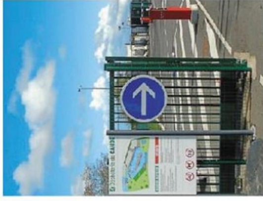
La déchetterie de Raguin, proche de Candé, va devenir une déchetterie d'Anjou Bleu communauté.

Le Sivoert est un syndicat intercommunal de valorisation et de recyclage