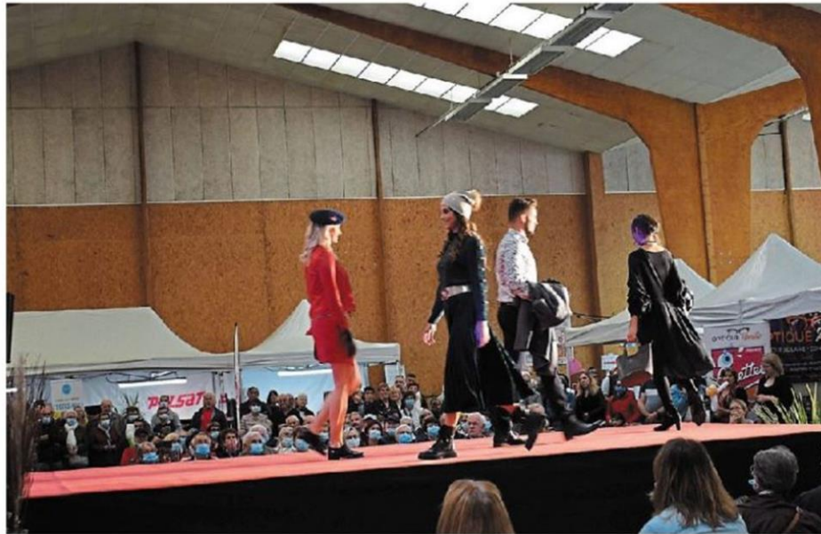
Le défilé de mode très prisé des Pouancéens est un des moments phare de la foire expo.

Les anciens artisans ou commerçants sont présents pour le coup de main, les uns au service des repas, les autres à la vente des chèques cadeaux, ou encore à la buvette ou à