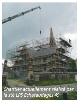
Chantier actuellement réalisé par la sté LPS Echafaudages 49

Messieurs MAINDROU et RIGAULT ont décidé de créer l'entreprise LPS ECHAFAUDAGES 49 au printemps 2021. Ils occupent depuis le 1 er avril dernier, un bâtiment relais appartenant à Anjou Bleu Communauté, d'une superficie