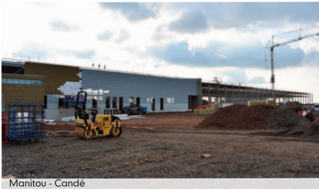
Manitou - Candé

La collectivité a également, depuis sa création, accompagné plusieurs dossiers marquants pour le territoire et notamment MANITOU et MITS (Candéen), GLOBAL RECOV et POLYTRANS (Pouancéen), et SOPHAN, LA TOUQUE ANGEVINE et LONGCHAMP (Segréen).