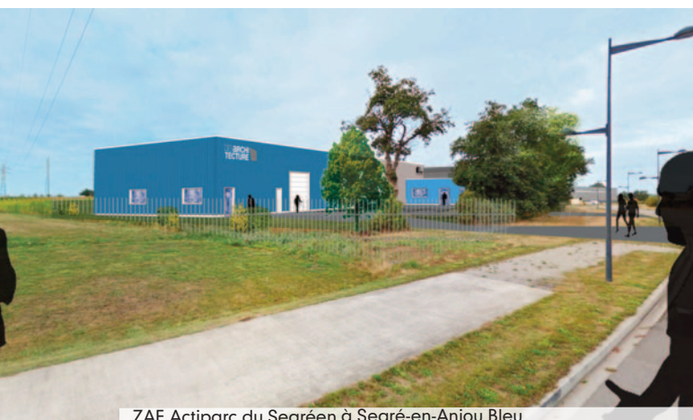
ZAE Actiparc du Segréen à Segré-en-Anjou Bleu

Au travers d'une politique ambitieuse de développement des liaisons douces, Anjou Bleu Communauté souhaite mettre en valeur et en avant le potentiel touristique, afin de soutenir toute une économie locale mais aussi développer l'attractivité du territoire. Ainsi, après l'ouverture de la dernière portion de la voie verte reliant Segré à Château-Gontier en 2017, les travaux d'aménagement du viaduc évoqués précédemment, par l'aménagement de la voie verte Segré - Pouancé - Châteaubriant, une autre liaison douce est en cours d'étude, il s'agit de l'aménagement du chemin de halage au bord de l'Oudon, afin de relier Segré et le Lion d'Angers, et proposer ainsi une « boucle » de l'ordre de 60 kms Segré – Le Lion d'Angers – Château-Gontier (un itinéraire provisoire est à l'étude, pour une mise en service en 2020).