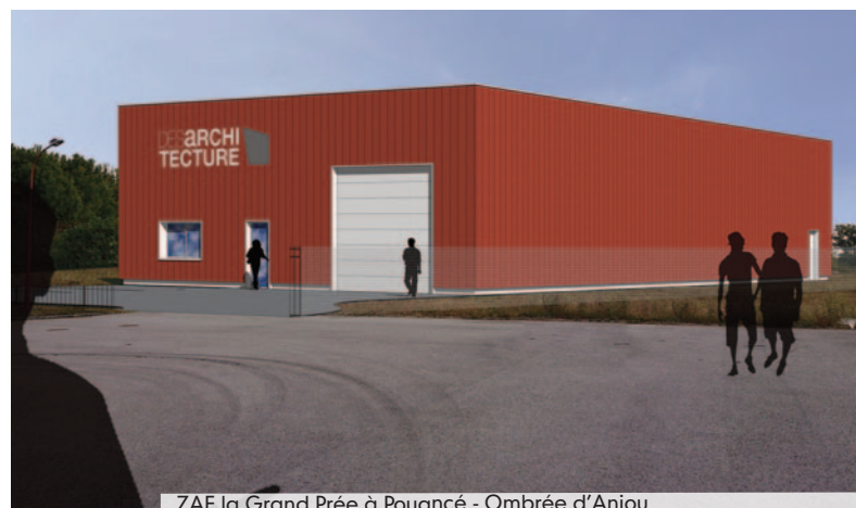
ZAF la Grand Prée à Pouancé - Ombree d'Anjou