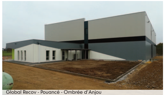
Global Recov - Pouancé - Ombree d'Anjou